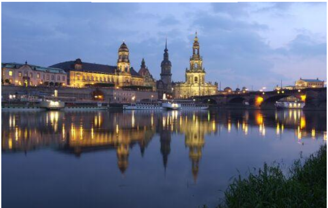
Drēzdenes vēsturiskā centra panorāma.