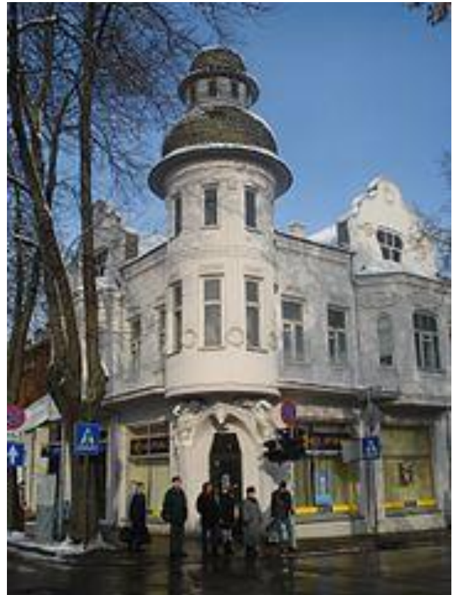
Daugavpils. Ēka Saules un Viestura ielu krustojumā