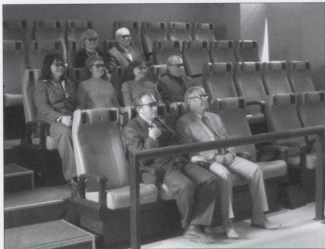
Учебный класс: чем не кинотеатр со стереоизображением?!