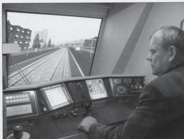
В кабине тренажера

комплекта оборудования. Оно используется для обучения будущих железнодорожников таким специальными предметам, как Конструкция и ремонт тепловозов, ПТЭ, ОКЖД, Охрана труда, Электрические машины и Автотормоза .