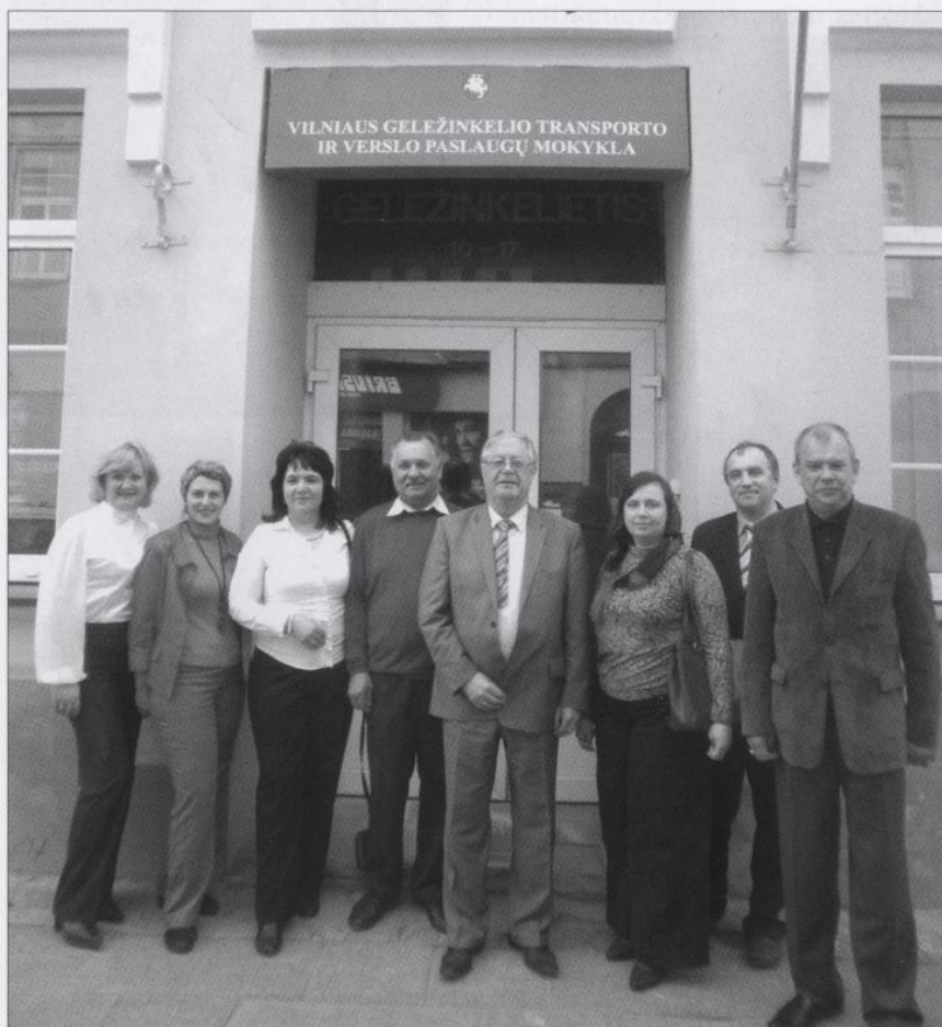
Делегация Даугавпилсского Государственного техникума вместе с руководством Вильнюсской профессиональной школы железнодорожного транспорта и сферы услуг

В классе также установлены экран формата 3D и кресла с симуляторами движения. Надо заметить, что этот кабинет не имеет аналогов в Европе. Поэтому с огромным интересом познакомились с условиями работы и возможностями подобного