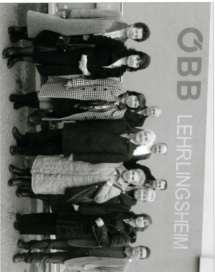
Гости и хозяйва Железнодорожного образовательного центра Книттельфельд

За время визита перед учителями нашего техникума гостеприимно распахнули Авери шесть профессиональных школ из Граца, Книттельфельда, Арнфельса,