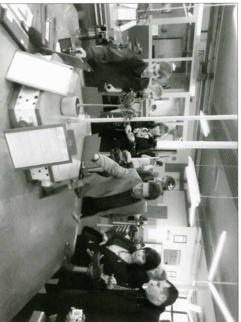
Азы профессии австрийская молодежь постигает в учебных мастерских

В центре трудятся 14 учителей-мастеров и получают профессиональное образование 157 учащихся. Железнодорожное предприятие не только обучает молодежь ремеслу, готова хорошо квалифицированных специалистов для железных дорог Австрии, но и зачисляет их в свой рабочий штат. После 3,5-летнего обучения молодые специалисты продолжают работать на железной дороге. ► 17 стр.